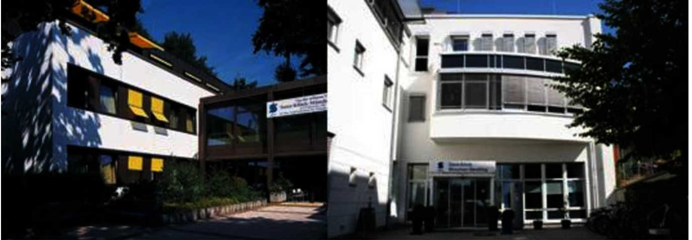
Abbildung: Sana Kliniken SolIn Sendling